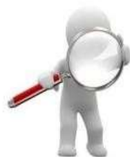
Tipos de Solicitudes