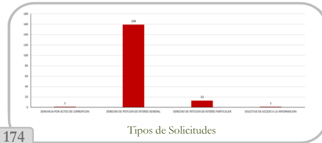
Tipos de Solicitudes